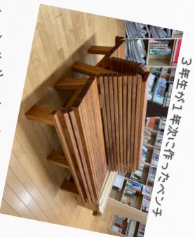
3年生が1年次に作ったベンチ

3年間たくさん使ってくれてありがとうございました！！ 高エに来た際には図書館にも 顔を出してね by 司書