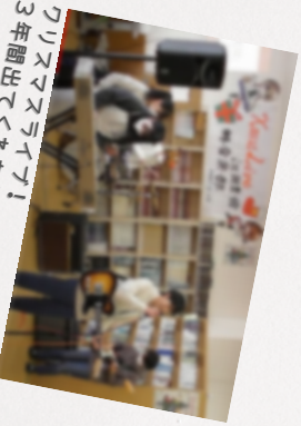
3年間出てくれた生徒もいました

☆新しいものが好きなので、図書館の新作コーナーが大好きでした。 具体的には「この本が借りた！」と目星をつけていかなかったも、ジャンルごと わかりやすく展示してあったので、興味のある本を見つけてやかったです。 ジャンル別の企画や本屋大賞の企画で、投票するものが楽しかったです！ 3年間ありがとうございました！